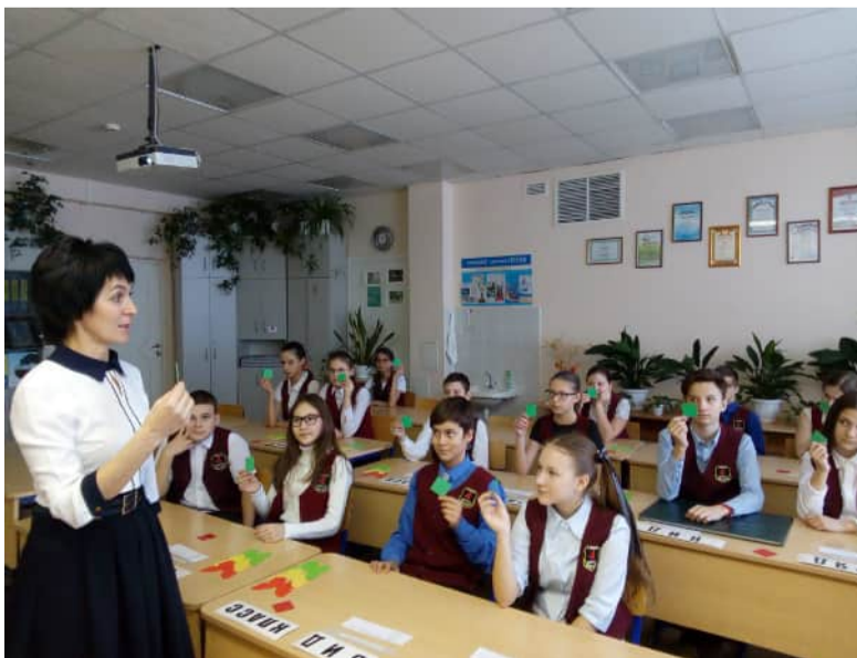
На уроках Светланы Кукурузы всегда царит творческая атмосфера

«У каждого человека есть свой Путь – путь, который он выбирает и идет по нему всю жизнь».