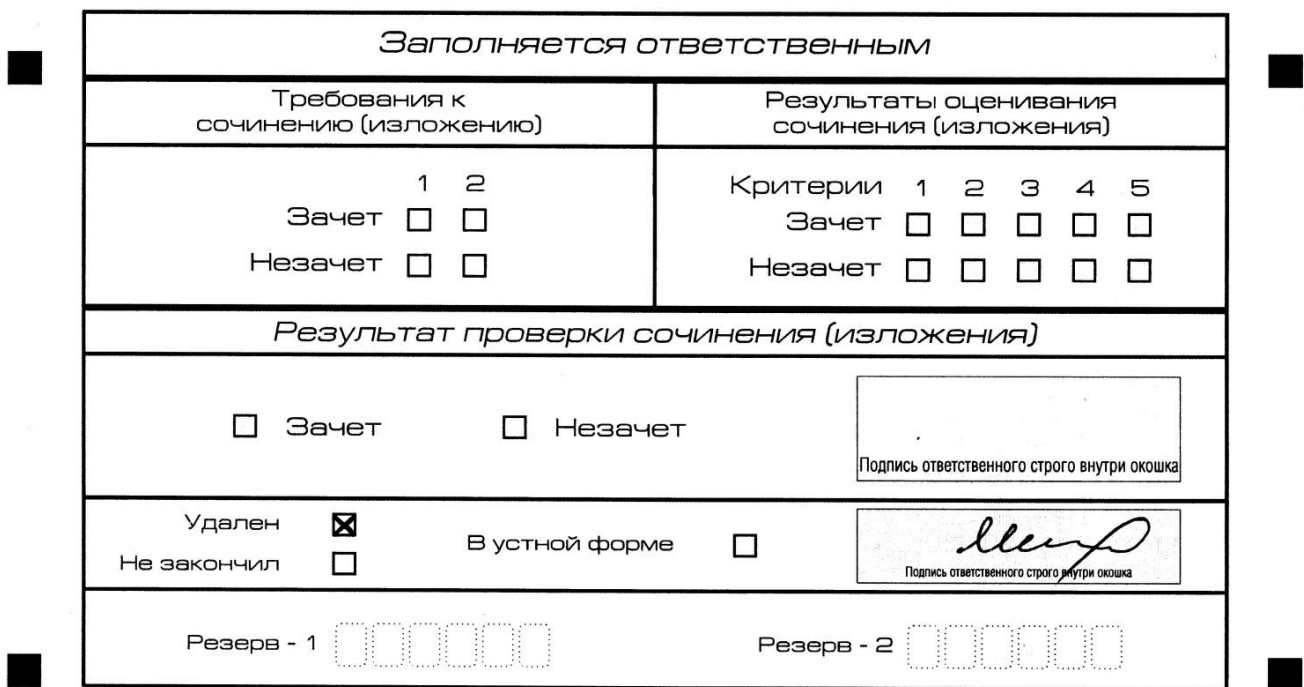
Рис. 13. Заполнение полей нижней части бланка регистрации (удаление с экзамена)

В случае если участник итогового сочинения (изложения) нарушил установленные требования, изложенные в пункте 28 Порядка проведения государственной итоговой аттестации по образовательным программам среднего общего образования (приказ Минпросвещения России и Рособрнадзора от 4 апреля 2023 г. № 232/551), он удаляется с итогового сочинения (изложения). Член комиссии по проведению итогового сочинения (изложения) составляет «Акт об удалении участника итогового сочинения (изложения)» (форма ИС-09), вносит соответствующую отметку в форму ИС-05 «Ведомость проведения итогового сочинения (изложения) в учебном кабинете ОО (месте проведения)» (участник итогового сочинения (изложения) должен поставить свою подпись в указанной форме). В бланке регистрации указанного участника итогового сочинения (изложения) необходимо внести отметку «X» в поле «Удален». Внесение отметки в поле «Удален» подтверждается подписью члена комиссии по проведению итогового сочинения (изложения) (см. рис. 13).