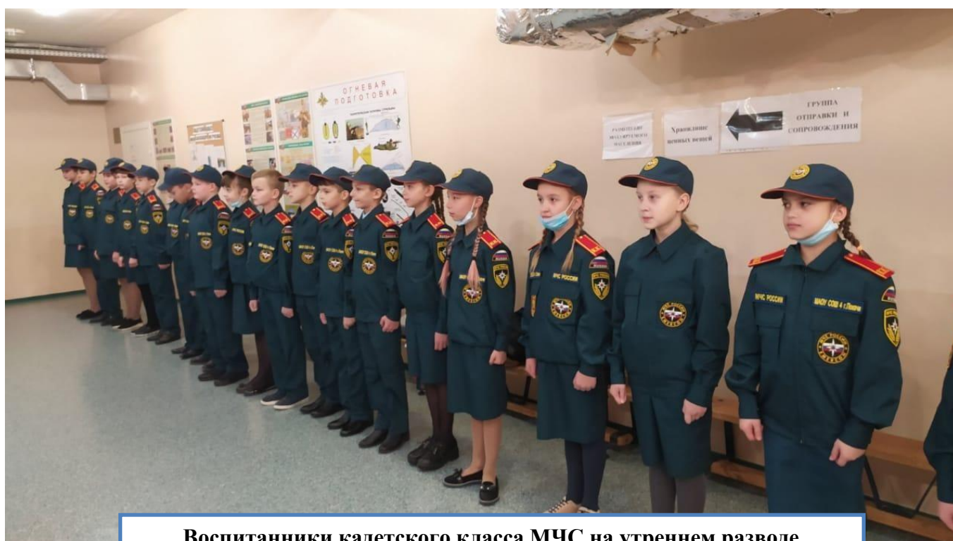
Воспитанники кадетского класса МЧС на утреннем разводе