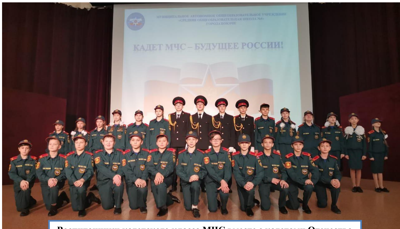
Воспитанники кадетского класса МЧС вместе с кадетами Отечества