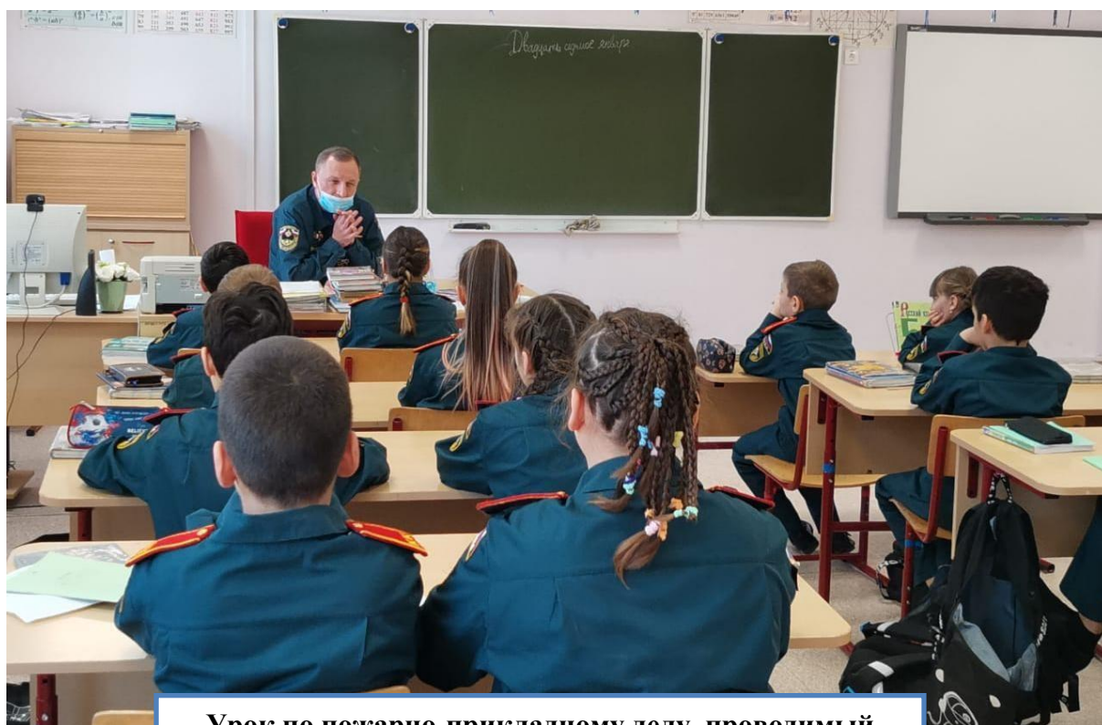
Урок по пожарно-прикладному делу, проводимый сотрудником 96-ой ПЧ