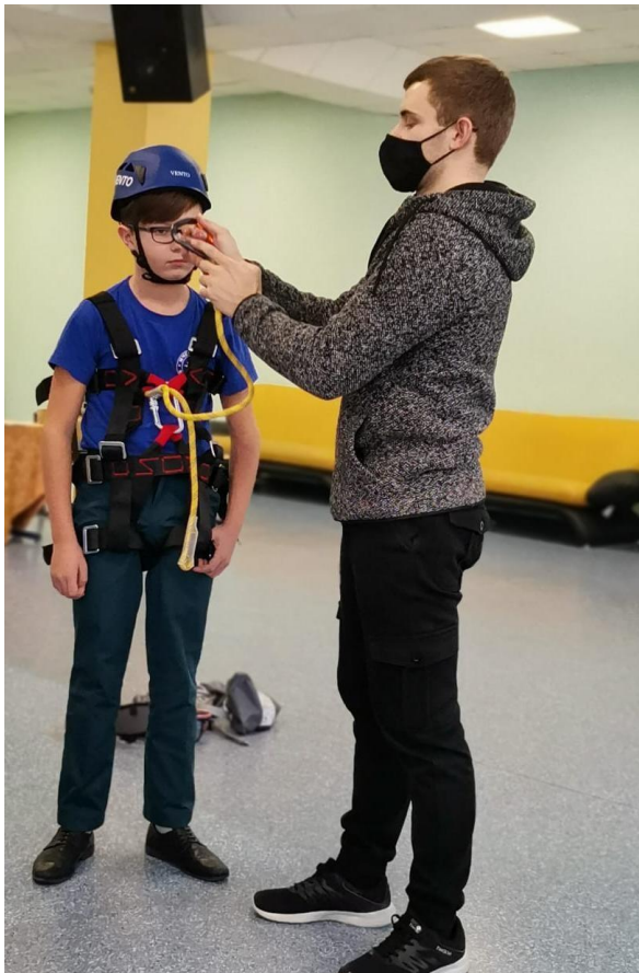
Кадет МЧС примеряет альпинистское снаряжение