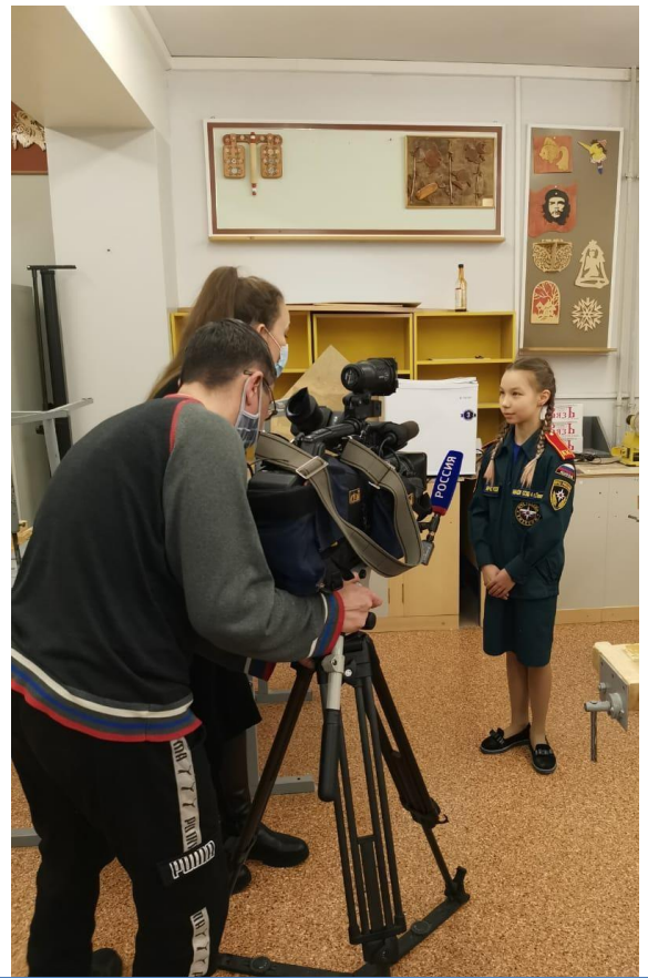
Кадет МЧС дает интервью журналисту телевидения «Россия-Югория»